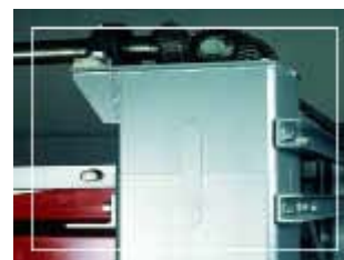
METTERE FOTO SITEC

Mensole avvitata per consentire l'aggiornamento del layout dei cassoni