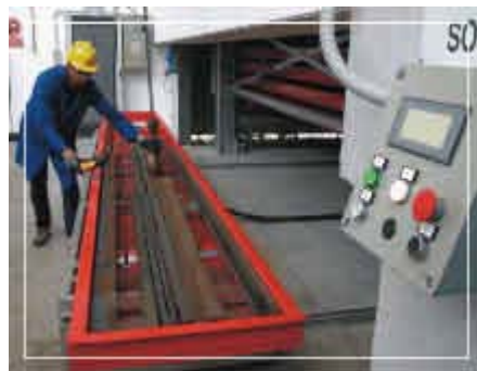
Organizzazione razionale e mirata del magazzino