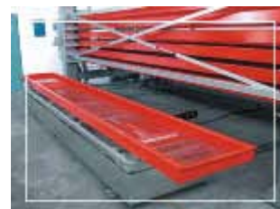
METTERE FOTO SITEC

Cassetto da 5 tonnellate con dimensione utile 640 x 300 x 6200