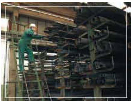
Problemi di gestione delle scorte di magazzino