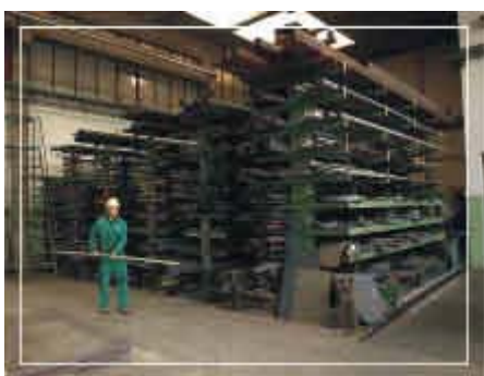
Difficoltà di movimentazione delle merci