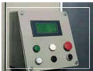
METTERE FOTO SITEC

Cassetto da 1 tonnellata con dimensione utile 640 x 120 x 6200