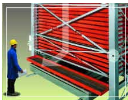
Assoluta fruibilità delle merci e perfetta organizzazione degli spazi