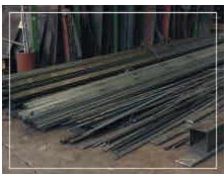
Tempi lunghi per la rintracciabilità dei materiali