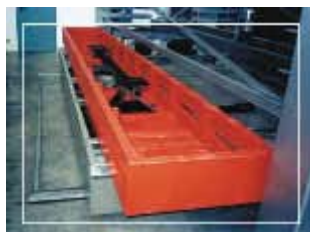
METTERE FOTO SITEC

Impianto elettrico provvisto di connettori per facilitare la modularità