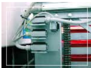
METTERE FOTO SITEC

Impianto elettrico provvisto di connettori per facilitare la modularità