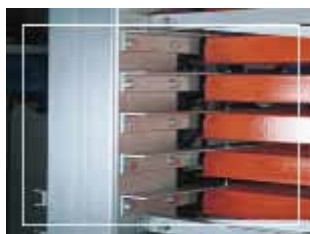
METTERE FOTO SITEC

pannello di controllo con ricerca per cassetto e per articolo