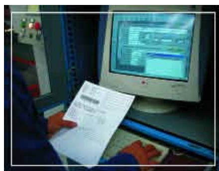
Ogni pezzo al posto giusto e disponibile al momento giusto